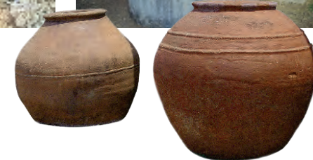
vpravo: Tyto nádoby sloužily k uchování olivového oleje.