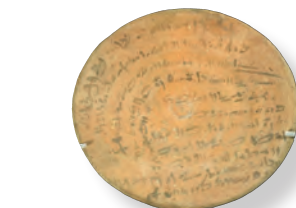
Snadno dostupné fragmenty rozbitých keramických nádob (tzv. ostraka) byly ve starověku často používány ke krátkým záznamům a dopisům.

Hromadění půdy bohatými bylo v 8. století proroky tvrdě odsuzováno, protože k němu obvykle docházelo na úkor chudých (Am 8,4; Mi 2,2; Iz 5,8).