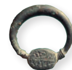
Tento prsten, na němž je vyryto jméno jeho nositele, pochází z 8.-7. století př. Kr.